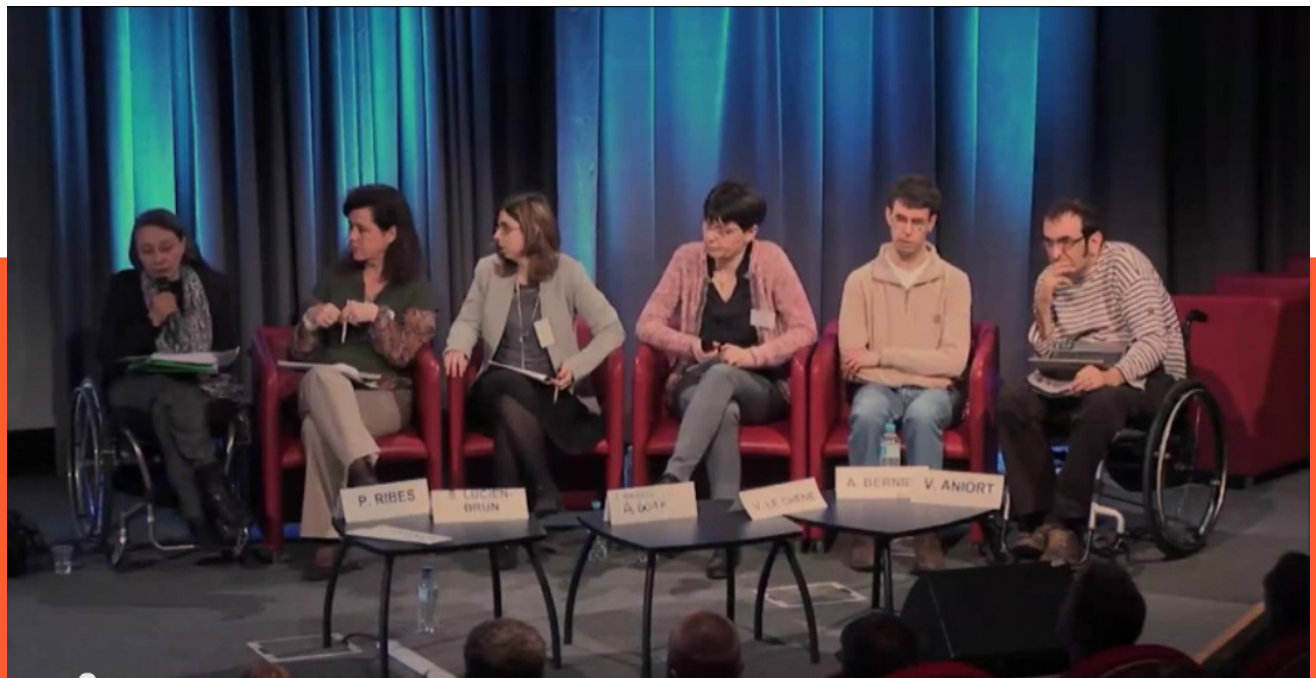
8ème Forum Européen de l'Accessibilité Numérique – Mars 2014 "L'utilisateur au cœur de l'accessibilité numérique Table Ronde introductive: "Les attentes des utilisateurs"